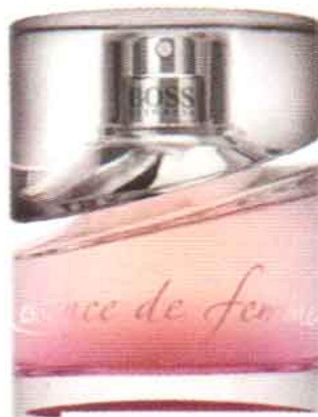
ESSENCE DE FEMME, DE BOSS.