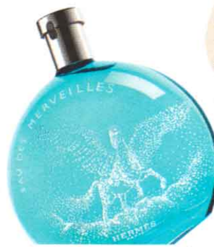
EAU DES MERVEILLES PÉGASE, DE HERMÈS.