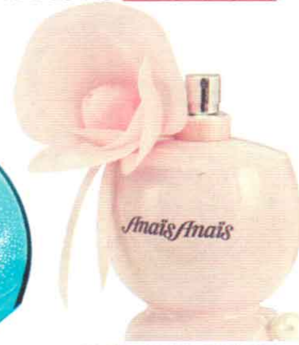
ANAÏS ANAÏS FLOWER EDITION, DE CACHAREL.

CADA EDAD (20, 30, 40 y más) ¡QUE HARÁN HISTORIA!