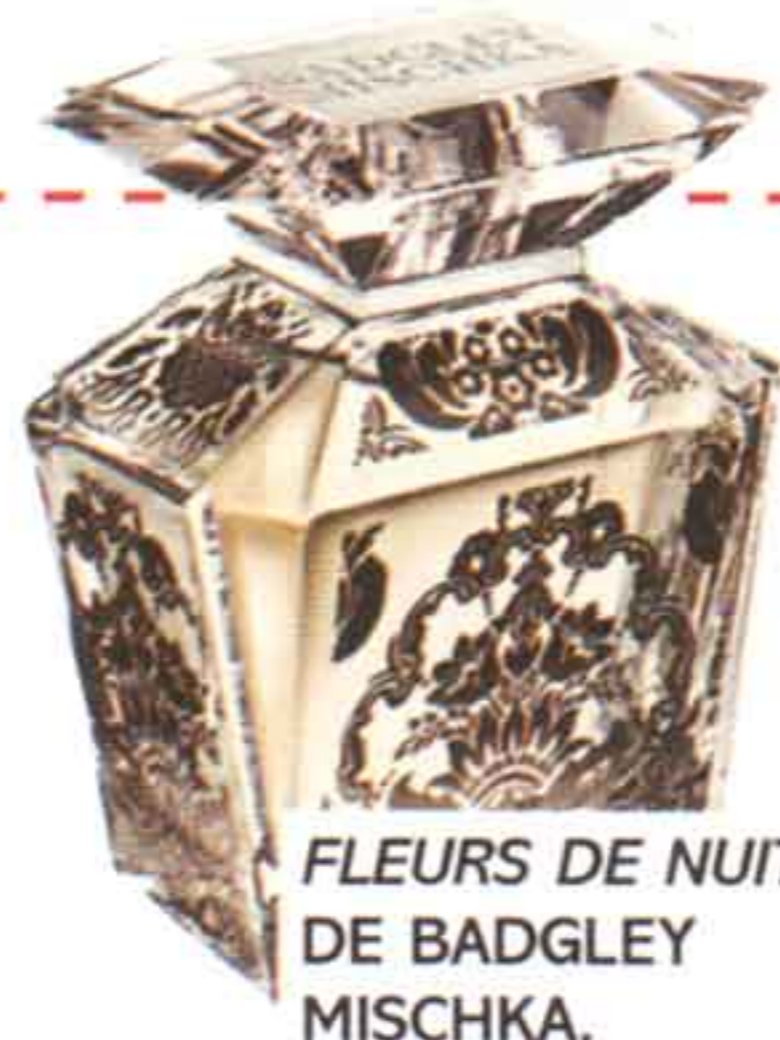
FLEURS DE NUIT, DE BADGLEY MISCHKA.

MARILYN LO DECÍA: "BASTA CON UNAS GOTAS DE TU PERFUME FAVORITO SOBRE LA PIEL PARA SENTIRTE VESTIDA". ASÍ ESTARÁS TÚ CON CUALQUIERA DE ESTAS 4 PROPUESTAS.